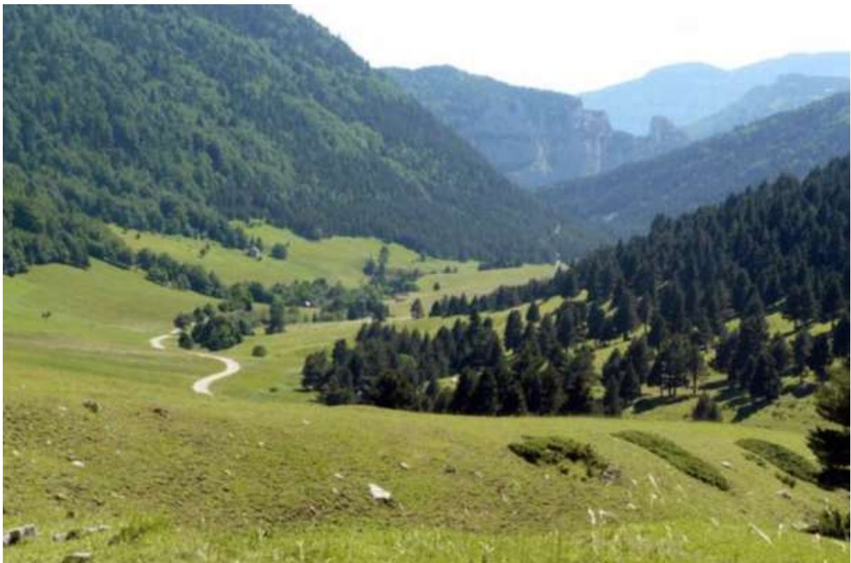
Descente vers le géosynclinal du vallon de Combeau avec vue sur les falaises majestueuses du Parc du Vercors et les immenses pierriers.