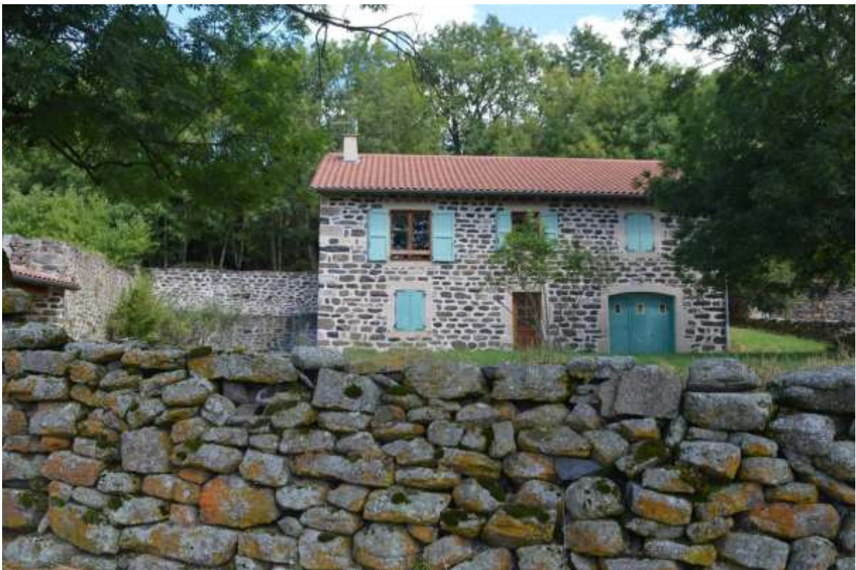
sa fontaine, sa maison de la béate, son four à pain en pierres basaltiques